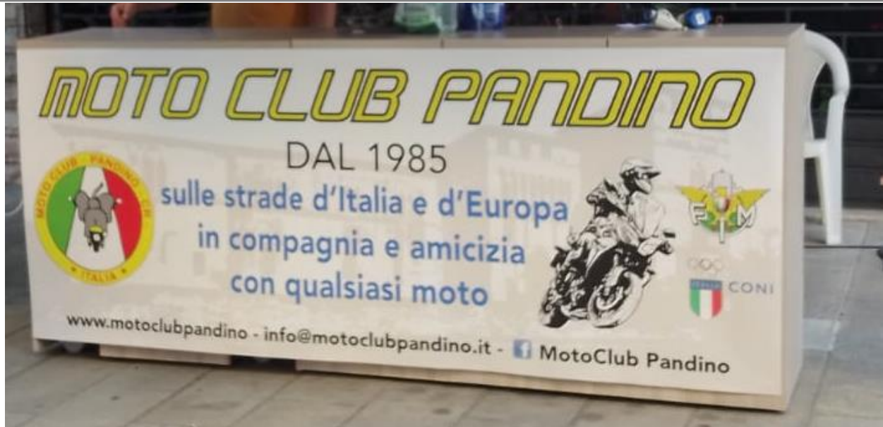
Foto stand nuovo